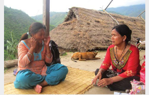
आफ्नै घरदेखि मनोविमर्श सेवा पाएपछि उल्लाहित पुनर्स्थापित महिला (बायाँ)

कोशिशको “आशाको घर” मा मानसिक स्वास्थ्यको उपचार गराई आफ्नो घरपरिवार, समुदायमा पुनर्स्थापित भएका महिलाहरूको अवस्थालाई ध्यान दिँदै प्रकृतिक विपद्का कारण मनोसामाजिक स्वास्थ्यमा परेका असरलाई न्यूनीकरण गर्न विभिन्न जिल्लाहरूमा मनोशिक्षा कार्यक्रम गरिएको छ ।