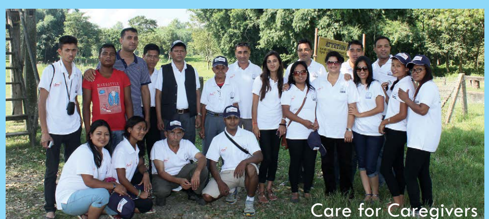
Care for Caregivers

मनोवैज्ञानिक आघातबाट कसरी बाहिर आउने भन्ने सम्बन्धमा तयार गरिएको जानकारी पुस्तिकाका साथै विपद्का लागि पूर्वतयारीसम्बन्धी पोष्टर पनि वितरण गरिएको थियो ।